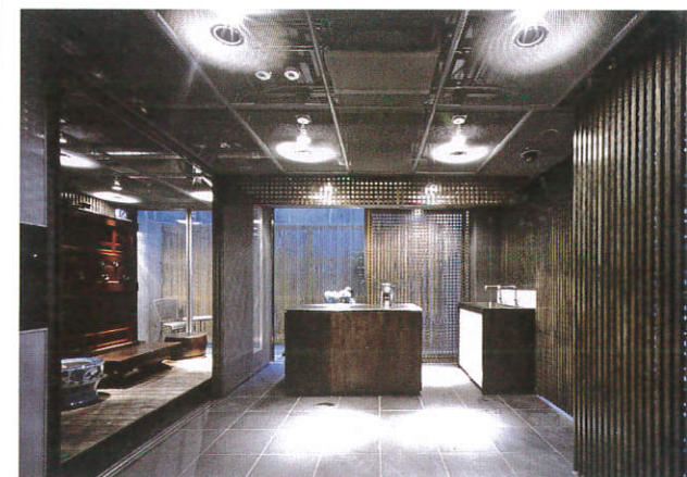
※ 1階エントランス内観 ※