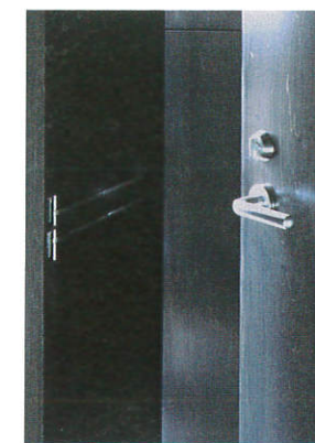
客室扉ディテール ※