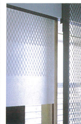
客室落とし掛け開口詳細 ※