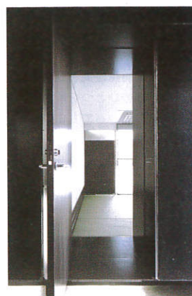
廊下より客室を見る ※

主な用途：旅館 Main use：Hotel 敷地面積：148.58 m 2 Site area：148.58 m 2 建築面積：119.09 m 2 Building area：119.09 m 2 延床面積：520.79 m 2 Total floor area：520.79 m 2