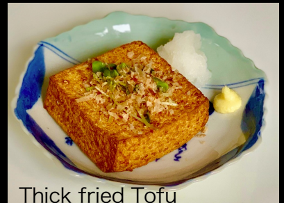
Thick fried Tofu