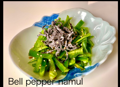
Bell pepper namul