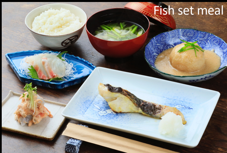
Fish set meal