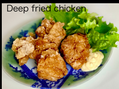
Deep fried chicken